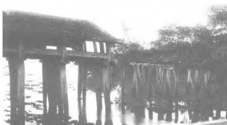
Ảnh đen trắng chụp cây Cầu Không vào năm 1939