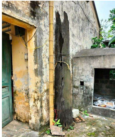
Trụ cầu của cây Cầu Không còn sót lại