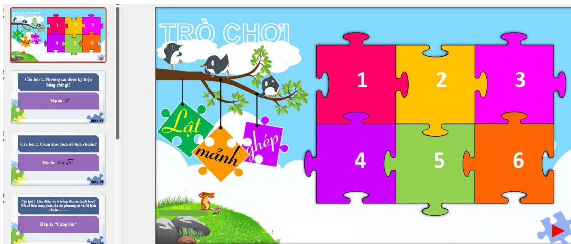
Hình 2. Giáo viên thiết kế trò chơi trên ứng dụng powerpoint